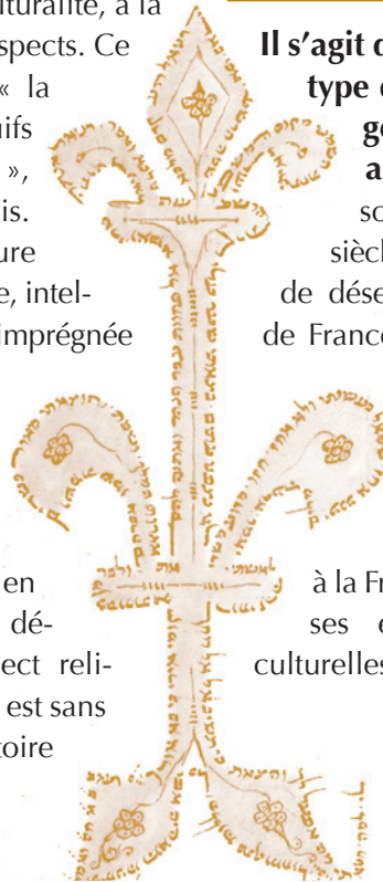
Fleur de lys en micro-lettres hébraïques, XV e siècle.