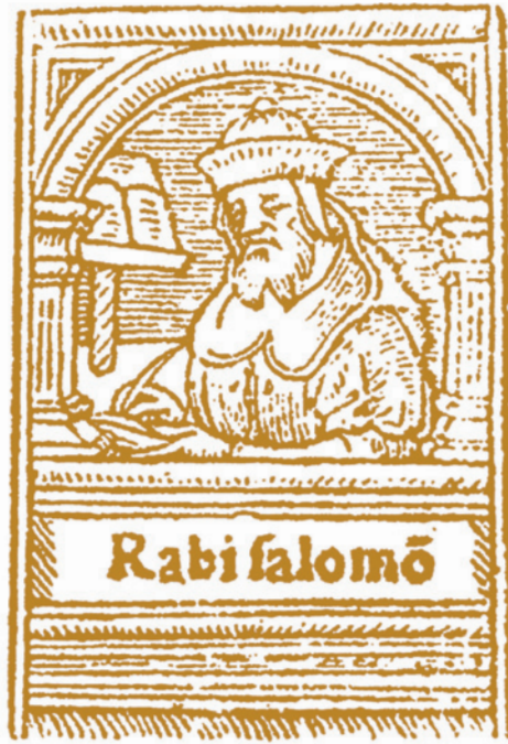
Rabbi Salomon ben Issac, dit Rachi de Troyes.

La présence juive sur un sol « français » en perpétuelle recomposition (des Gaules romaines à l'Empire colonial) n'a jamais été qu'un simple fait démographique. Elle a au contraire contribué, par une active interculturalité, à la vie du pays dans tous ses aspects. Ce n'est pas seulement que « la France sans ses citoyens juifs ne serait plus la France », comme on le dit parfois. C'est que toute la culture française – politique, sociale, intellectuelle, artistique – est imprégnée par une relation unique en son genre avec le fait juif. Et inversement, il est possible d'affirmer que le judaïsme d'aujourd'hui, de New York à Jérusalem en passant par l'Europe, qui déborde largement son aspect religieux, ne serait pas ce qu'il est sans sa longue, très longue histoire